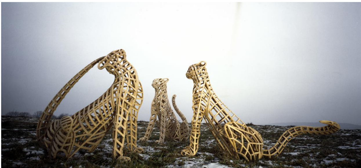
Pantheria, dřevo, 90. léta